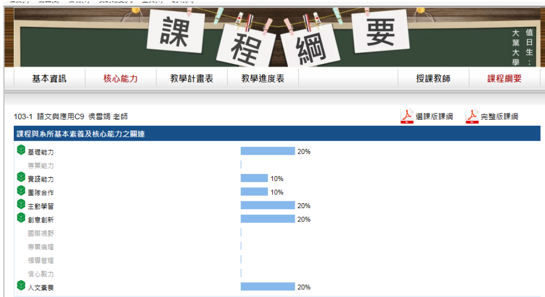
圖 1-1-2 國文能力「語文與應用」課程與核心能力之基本素養呼應情形

在以學生主體、能力本位的教育思潮中，本校通識教育除了傳授知識本體，在教學場域裡也落實校訓「手腦並用」與「知行合一」的理念。基礎課程與通識五大領域核心課程的教學，又分認知、情意與實踐三個面向，其具體的能力目標，如下表1-1-4所列。